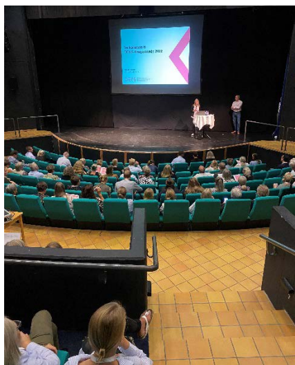
Åbning Brugermøde 2022

Abstracts og præsentationer fra Brugermødet kan findes på deks.dk .