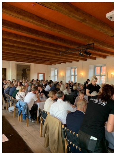
Middag på Sønderborg Slot